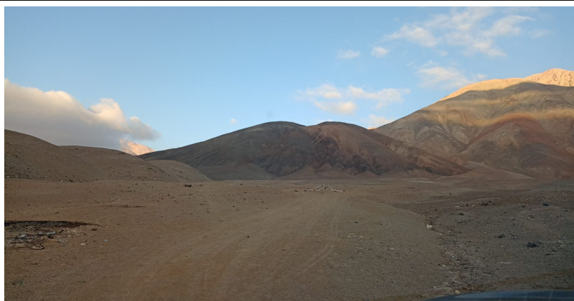
FOTOGRAFIA N°01: Vista de identificación de la vulnerabilidad a inundaciones, ZONA CRITICA EN LA QUEBRADA JAQUI III, SECTOR PATAHUASI, DISTRITO DE JAQUI, PROVINCIA DE CARAVELI Y DEPARTAMENTO DE AREQUIPA