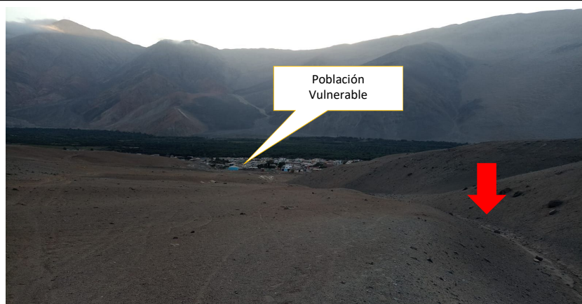
FOTOGRAFIA N°02: ZONA CRITICA EN LA QUEBRADA JAQUI III, SECTOR PATAHUASI, DISTRITO DE JAQUI, PROVINCIA DE CARAVELI Y DEPARTAMENTO DE AREQUIPA